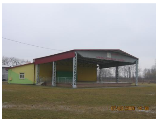
(fot. Scena promocyjna w Samborcu)

- teren rekreacyjno-promocyjny wraz ze stałą sceną , który znajduje się w bezpośrednim sąsiedztwie budynku publiczno-administracyjnego w Samborcu. Obszar ten, wraz z wchodzącym w jego skład boiskiem piłkarskim umożliwia organizację szeregu różnych imprez i wydarzeń o charakterze kulturalnym, sportowym i promocyjnym. Jest to m.in. centralne miejsce corocznego Wojewódzkiego Święta Kwitnącej Jabłoni.