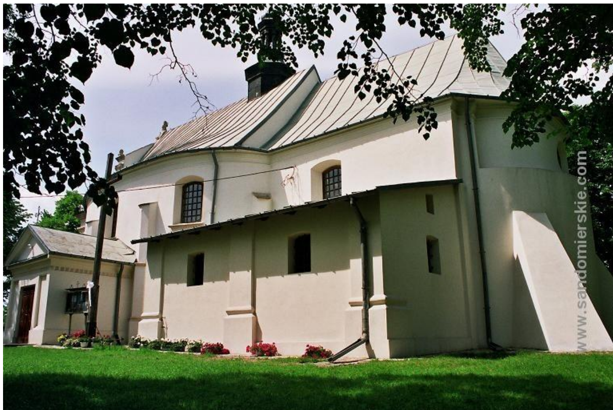
(fot. Zabytkowy Kościół Parafialny p.w. św. Trójcy w Samborcu)