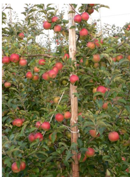
Fot. Młody sad jabłoniowy w Samborcu w okresie wiosennym i jesiennym