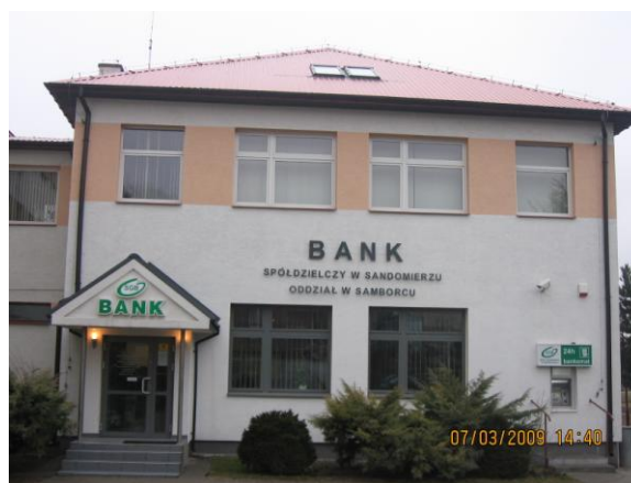
(Fot. Wejście główne do budynku wielofunkcyjnego oraz budynek Banku Spółdzielczego w Samborcu)

- Ochotnicza Straż Pożarna w Samborcu. OSP posiada własny, piętrowy budynek remizy, zlokalizowany przy drodze krajowej nr 79. Ochotnicza Straż Pożarna w Samborcu pełni niezwykle ważne funkcje, nie tylko w zakresie ratowania życia i mienia ludzkiego (pożary, lokalne powodzie itd.) ale również w aspekcie społeczno-kulturalnym (np. aktywny udział w lokalnych świętach i obchodach rocznicowych np. w ramach Wojewódzkiego Święta Kwitnącej Jabłoni w Samborcu). Należy podkreślić, że OSP Samborzec należy do Krajowego Systemu Ratownictwa.