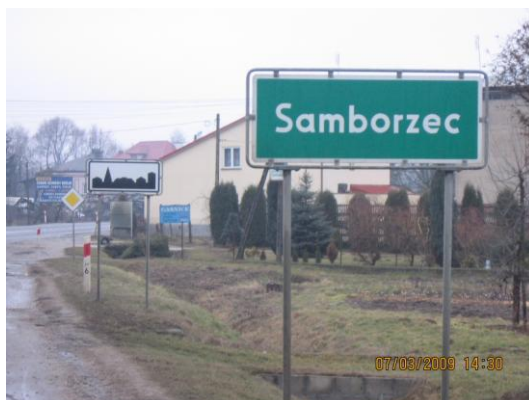
(fot. Wjazd do Samborcu drogą krajową nr 79 od strony Sandomierza)

Administracyjnie Samborzec od wielu lat jest siedzibą gminy, lecz w zmiennych granicach. Przykładowo w latach międzywojennych Samborzec był wymieniany w postaci 3 miejscowości, a mianowicie: Samborzec folwark, Samborzec wieś i Samborzec Poduchowny wieś. Dziś te przysiółki wchodzą w skład jednego sołectwa pod nazwą Samborzec.