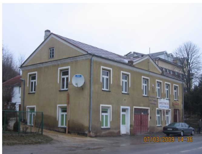
(Fot. Budynek OSP w Samborcu)

- Ochotnicza Straż Pożarna w Samborcu. OSP posiada własny, piętrowy budynek remizy, zlokalizowany przy drodze krajowej nr 79. Ochotnicza Straż Pożarna w Samborcu pełni niezwykle ważne funkcje, nie tylko w zakresie ratowania życia i mienia ludzkiego (pożary, lokalne powodzie itd.) ale również w aspekcie społeczno-kulturalnym (np. aktywny udział w lokalnych świętach i obchodach rocznicowych np. w ramach Wojewódzkiego Święta Kwitnącej Jabłoni w Samborcu). Należy podkreślić, że OSP Samborzec należy do Krajowego Systemu Ratownictwa.